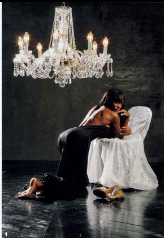
1. Ormai protagonista nell'arredamento della casa, il cristallo artistico sa inserirsi con grazia nei più diversi contesti. Ne sa qualcosa Voltolina , sinonimo di cristallo e vetro d'alta qualità nel campo dell'illuminazione. I lampadari Voltolina sono apprezzati anche per il rapido e sicuro sistema di montaggio "Leonardo". Nella foto un lampadario serie Barcellona prodotto in cristallo e lavorato a mano da maestri vetrai.

2. Zuccon Passamanerie Negozio: Via Manin 60 - Treviso Tel. 0422 540979 Ingrosso: Via Venier 15/a Marcon (VE) Tel. 041 4568566 Fax 041 4569772 info@passamaneriezuccon.com www.passamaneriezuccon.com