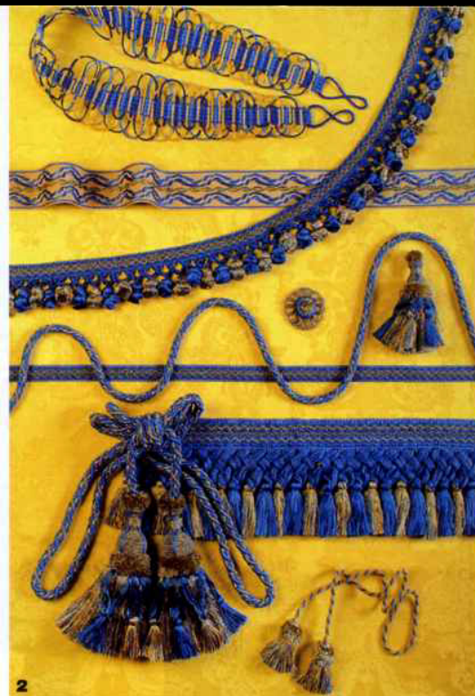
2. Attiva da 30 anni, Zuccon Passamanerie è in grado di gestire forniture di qualsiasi entità per privati, piccoli laboratori e grandi industrie: montature per tendaggi, binari, bastoni di ogni genere ed una vasta gamma di passamanerie come cordoni, fiocchi, frange, bordi e vari articoli di merceria. Inoltre realizza con grande professionalità passamanerie su campione di tessuto e rifacimenti d'epoca basati sullo studio dei modelli originali.

3-4. Lav.In Via F.lli Cervi Concordia Sagittaria (VE) Tel. 0421 703586 Fax 0421 289091 www.lav-in.it info@lav-in.it